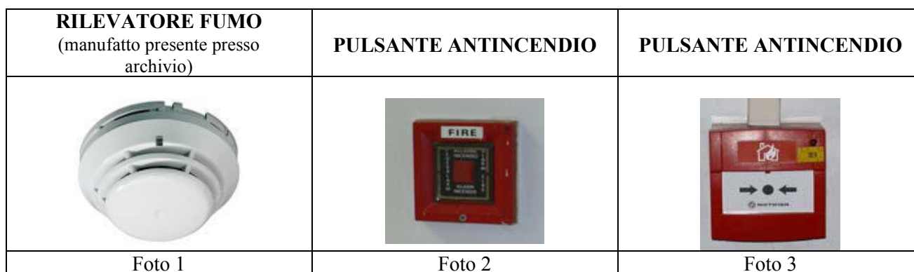
Foto 3: premendo con una semplice pressione del dito sul tondo nero indicato dalle due frecce vengono attivate le sirene di allarme antincendio e le misure di sfollamento dell'edificio.

Foto 2: rompendo il vetrino vengono attivate le sirene di allarme antincendio e le misure di sfollamento dell'edificio.