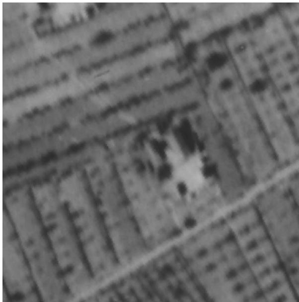
Fotografia riprese nell'anno 1943.

Trattasi di edificio principalmente destinato a locale di deposito. Il fabbricato è visibile sia nelle fotografie aeree fornite dalla Provincia di Arezzo e risalenti al 1943 sia nella cartografia dell'ente irrigazione del 1972.