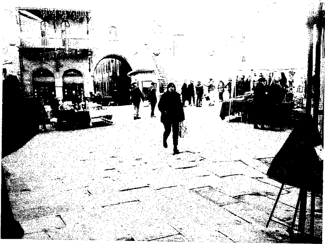
Piazza della Repubblica